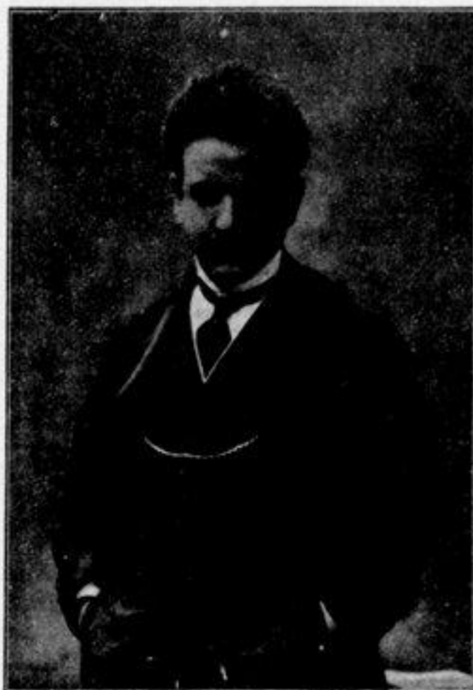
M. Enrico Bossi.